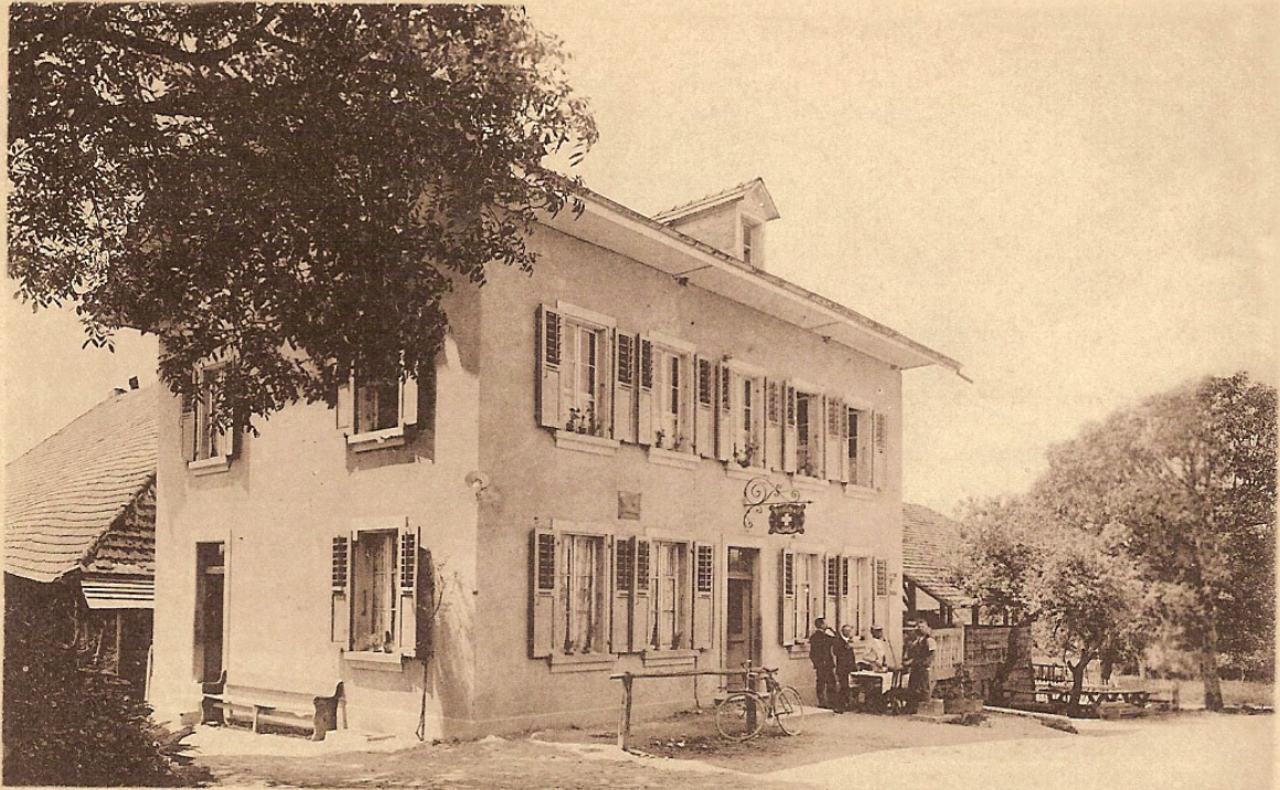
1491. – Wirtschaft – Courlevon